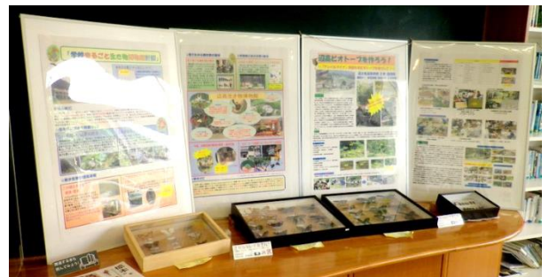
写真：サイエンス部企画展看板