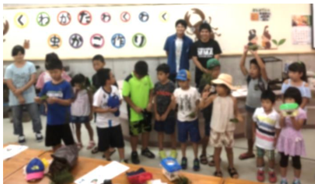
写真：参加した子ども達と