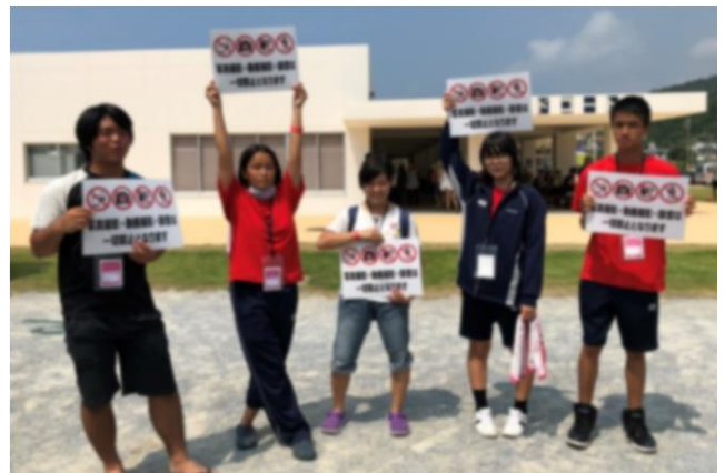
写真：HYミニライブのスタッフー！