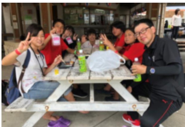
写真：ゴミ拾い後の昼食は最高！