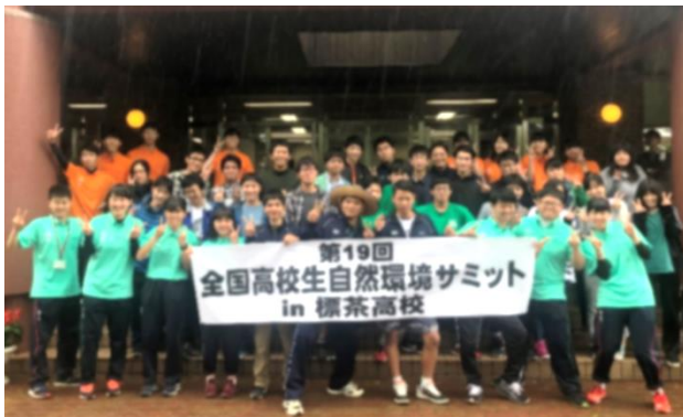
写真：集合写真「来年は辺土名高校で！」