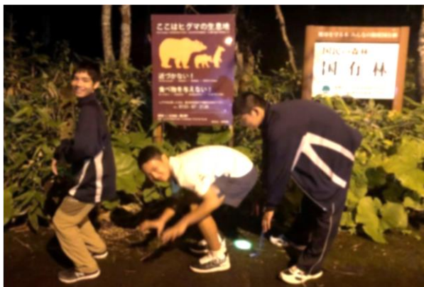
写真：世界自然遺産、知床半島にて！