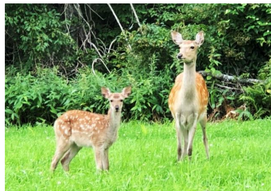
写真：標茶高校校庭に現れたエゾシカ