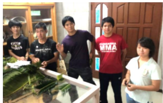
写真：ボランティアスタッフ